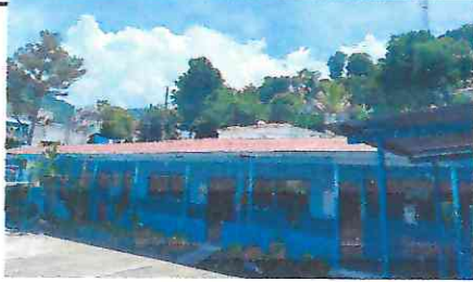
Foto1: Sustitución de lámina por lámina troquelada en 4 salones y baños.