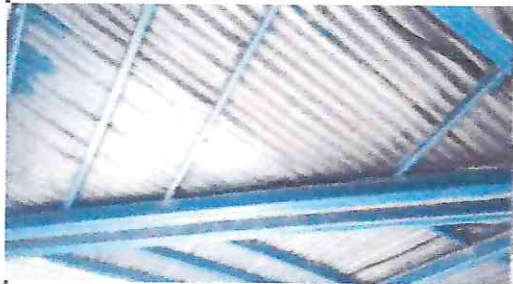
Foto 5: Sustitución de lámina por lámina troquelada en la entrada cerca de la Dirección.