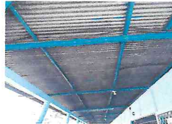
Sustitución de lámina por lámina troquelada, corredor frente los 4 salones y baños.