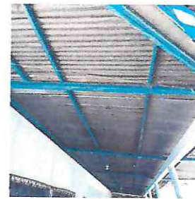
Foto 4: Sustitución de lámina por lámina troquelada corredor frente a las tres aulas.